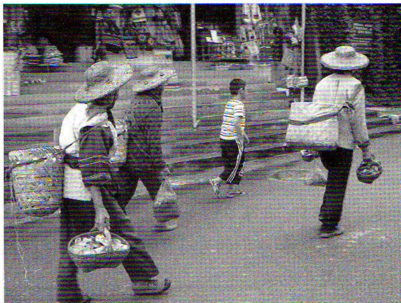
婦女外出工作 / 妇女外出工作